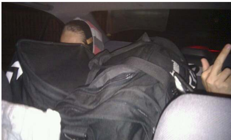
(4 mand i en bil – Fedt fedt fedt)

Da vi så endelig ankommer til LAN, så kommer kampene først i gang om natten kl. 02:00